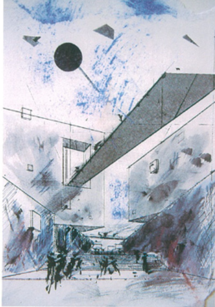
Idékonkurrence om et kulturcenter i Samarkand, 1991. Perspektiv af hovedstrøg.