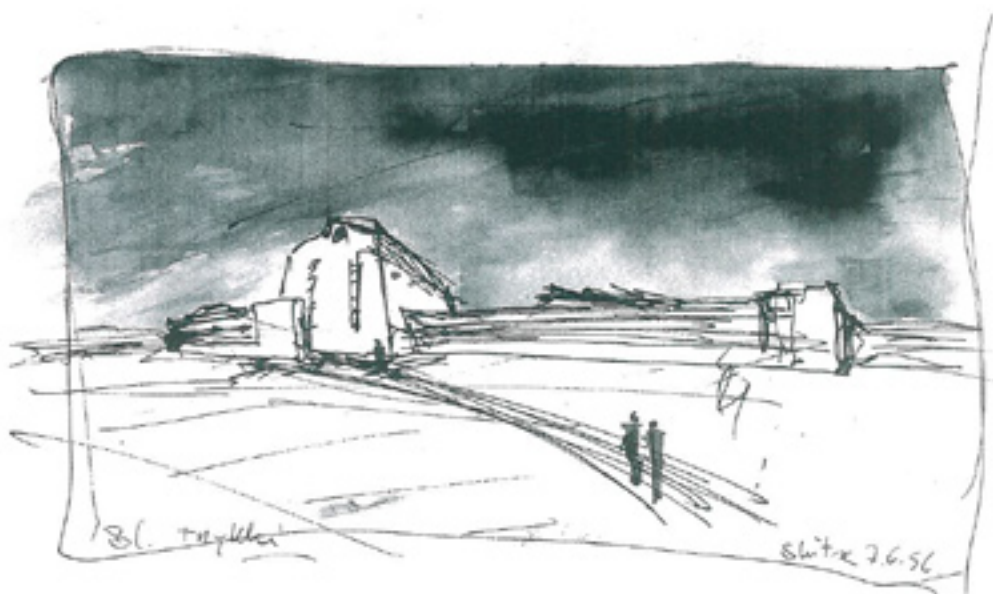
Skitse til en fabrik, 1956.