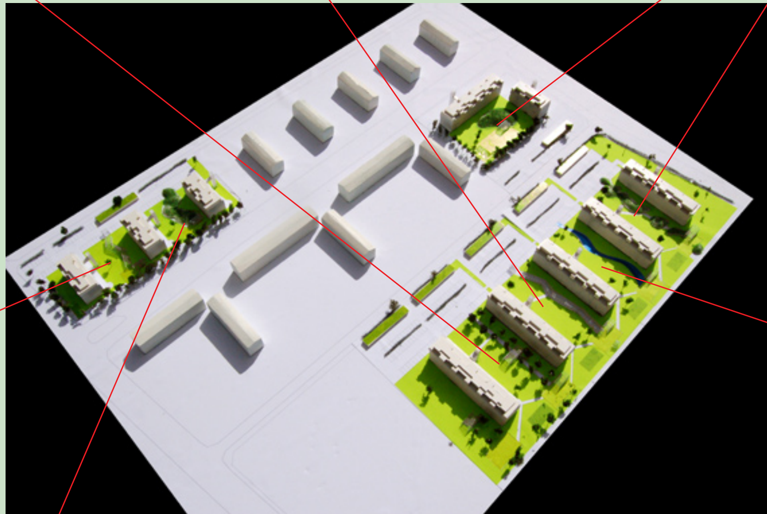
Model af bebyggelsesområdet