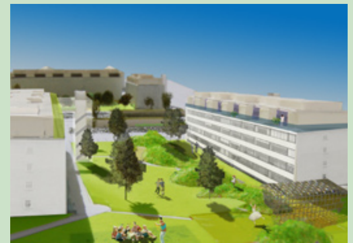
Ophold for alle og leg for børn - sommer og vinter BAKKER