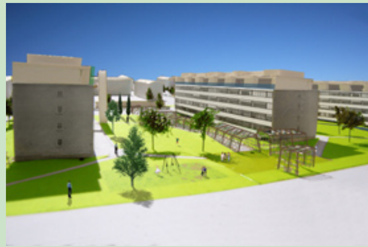
Private opholdszoner og skygger i sommersolen. PERGOLA