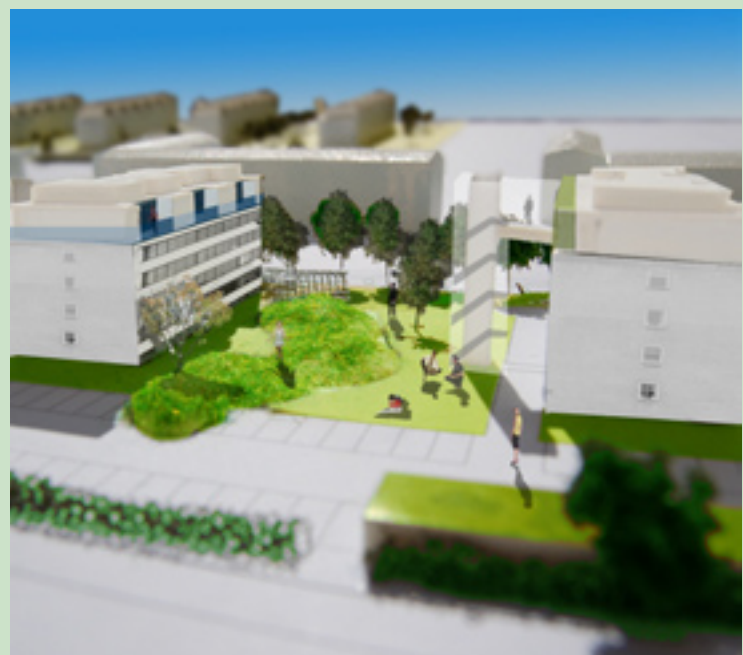
Tilgængelige bakker med mulighed for leg og ophold. BAKKER