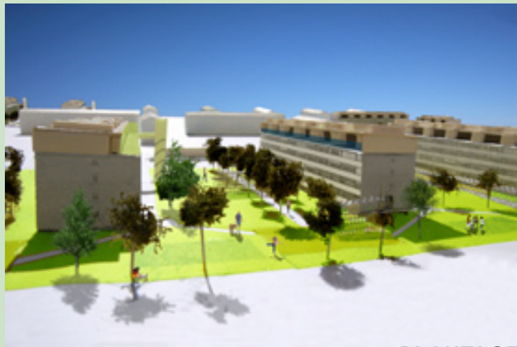
Grønne frugttræer og skygger i sommersolen. PLANTAGE