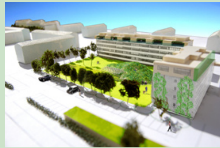
Leg for børn - både om sommeren og vinteren. BJERG