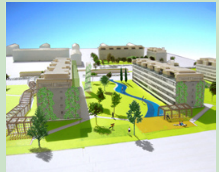
"ÅEN" Asfalteret zone - aktivitet for alle og leg for børn