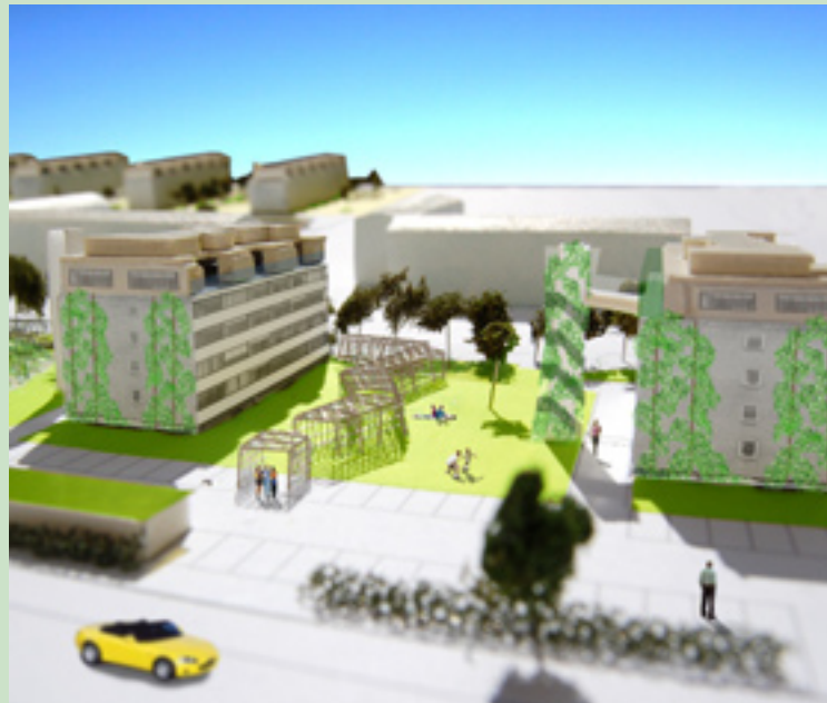
Behagelig gennemgang og ophold - i sol og gråvej. PERGOLA