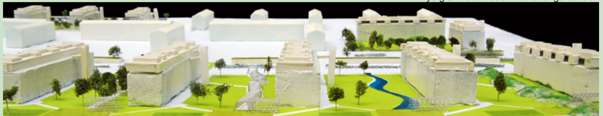
Nye grønne områder - Forskellige temaer